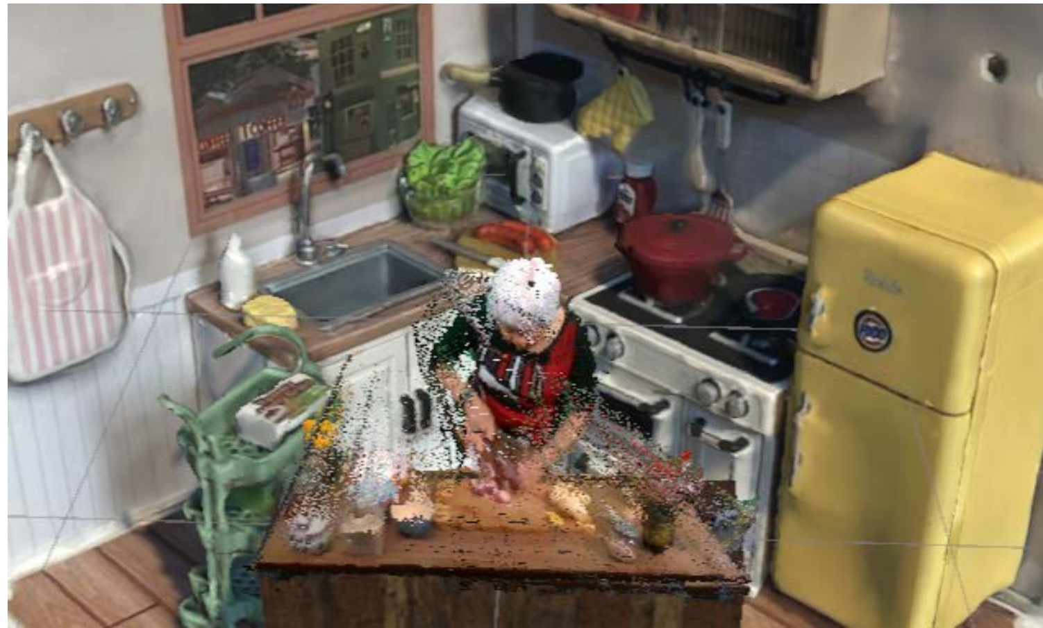
présentation de residence

Jing's Poetic Cartography Présentation de résidence - Yutong Lin Mercredi le 5 juin 2024